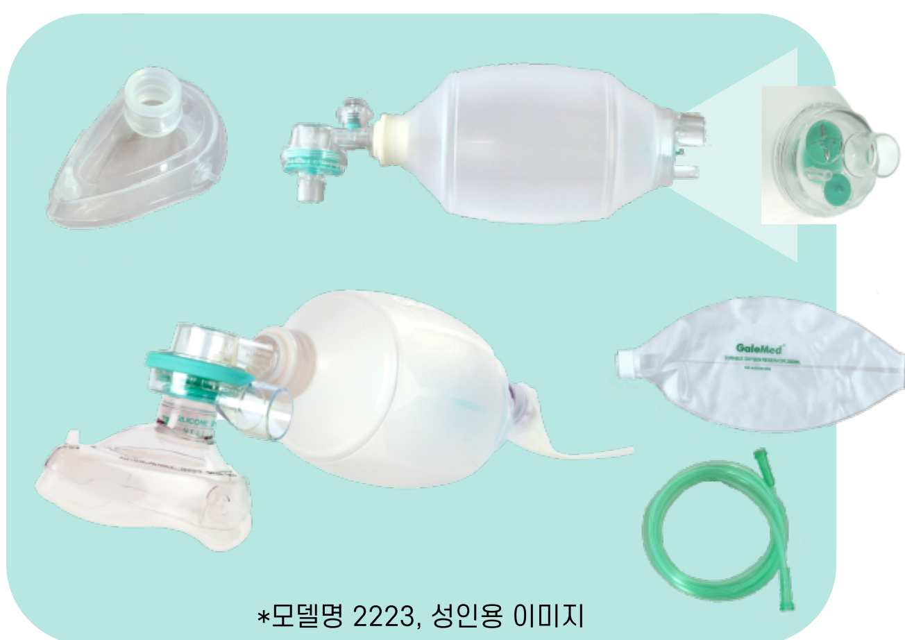
*모델명 2223, 성인용 이미지